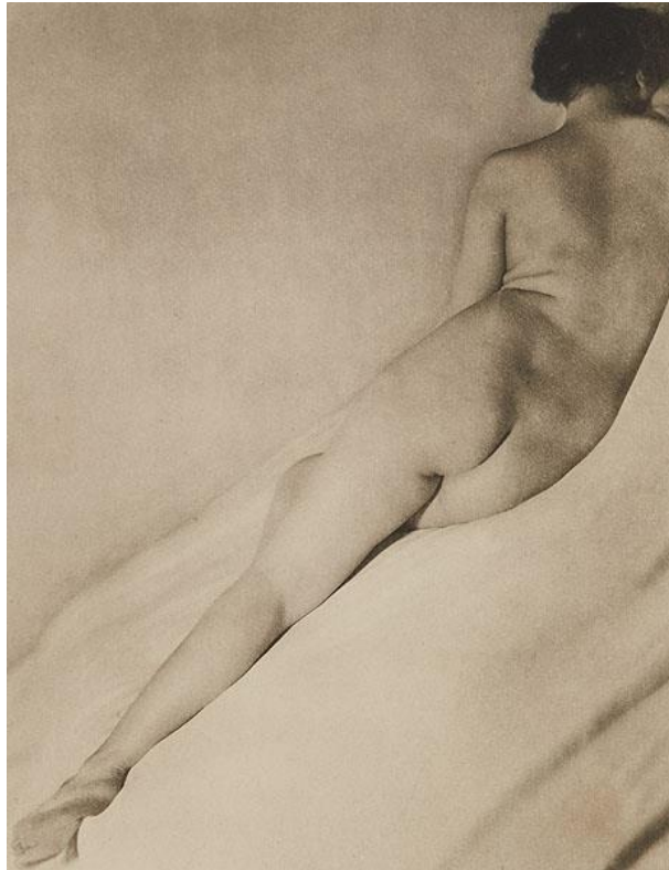
Extraits de nus photographiés par Laure Albin-Guillot pour le livre de Montherlant La Déesse Cypris publié en 1946