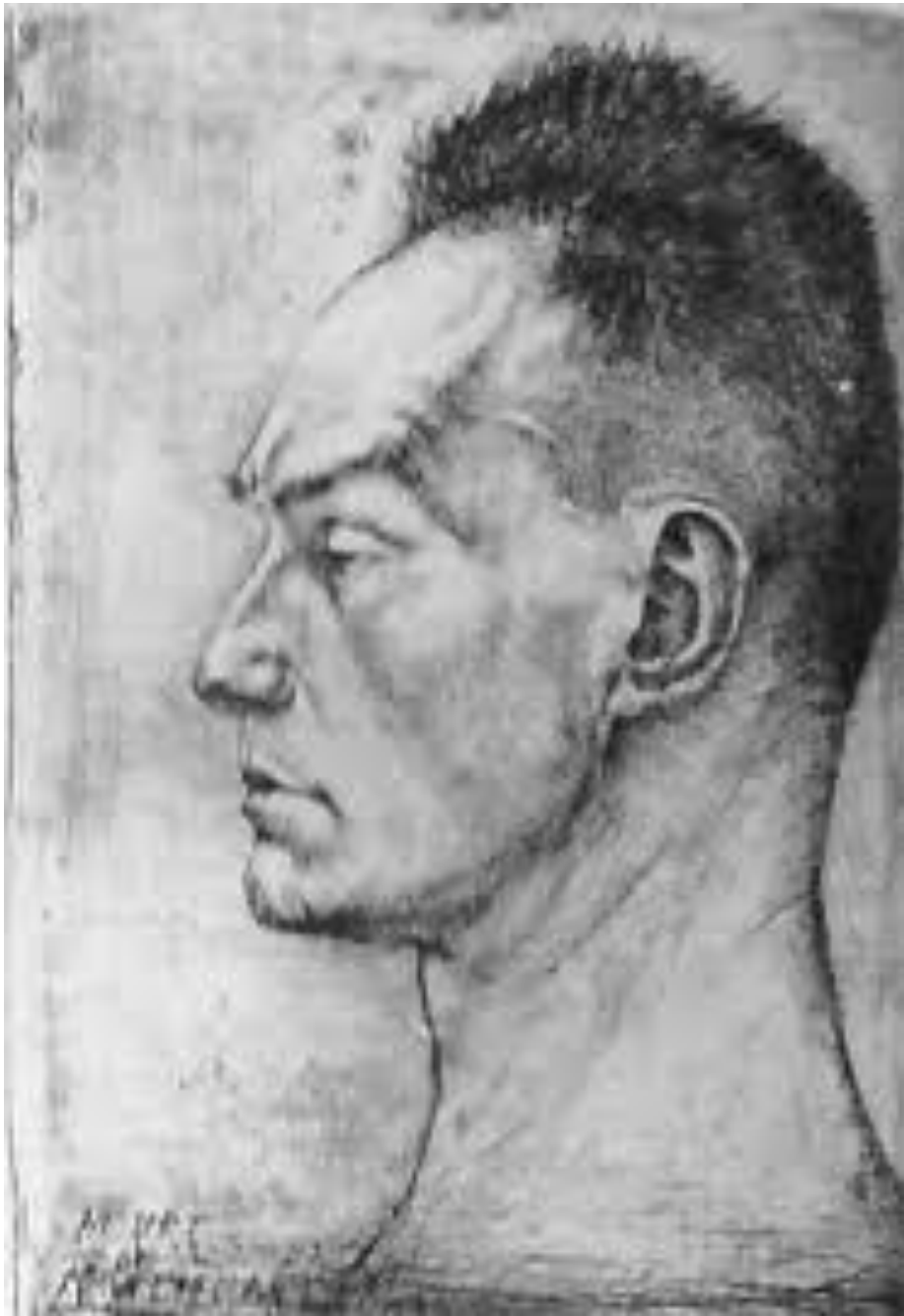
Montherlant par Pierre-Yves Trémois