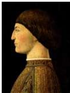
Sigismond de Malatesta, Seigneur de Rimini