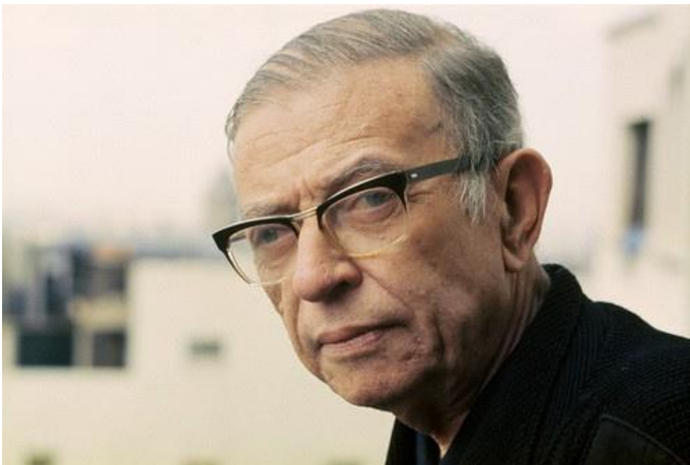
Jean-Paul Sartre 1905-1980

Note (1) : Jean-Paul Sartre , né le 21 juin 1905 dans le 16 e arrondissement de Paris et mort le 15 avril 1980 dans le 14 e arrondissement, est un écrivain et philosophe français, représentant du courant existentialiste, dont l'œuvre et la personnalité ont marqué la vie intellectuelle et politique de la France de 1945 à la fin des années 1970.