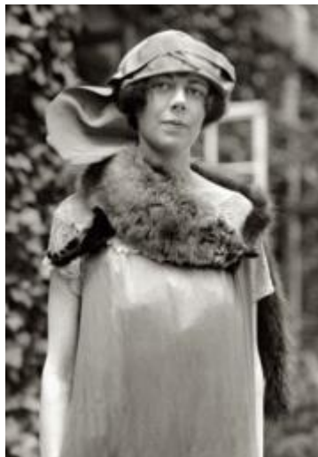
Béatrix Beck 1914-2008

Notes : (1) Béatrix Beck , écrivaine française d'origine belge, née le 30 juillet 1914 à Villars-sur-Ollon (Suisse), naturalisée française le 12 janvier 1955 et morte le 30 novembre 2008 à Saint-Clair-sur-Epte. Écrivain majeur et discret, prix Goncourt en 1952 , fille du poète Christian Beck, elle fut la dernière secrétaire d'André Gide qui l'avait incitée à écrire sur ses expériences, le suicide de sa mère, la guerre, la pauvreté. Puis, à partir de 1979, s'écartant de la fiction autobiographique, son écriture prend un tournant décisif où se révèlent toute sa fantaisie et son extraordinaire virtuosité jubilatoire de langue française.