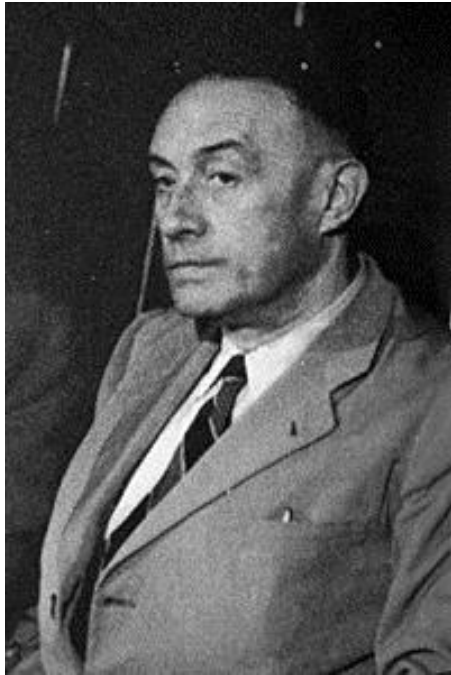
Henry de Montherlant

oooooooooooooooooooooooooooooooooooooooooooooooooooooooooooooooooooooooooooooooooooooooooooooooooooooooooooooooo