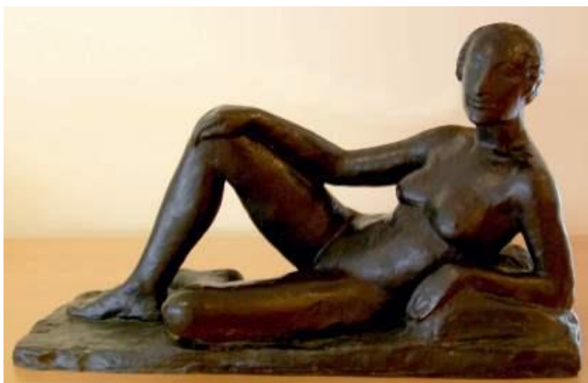
Nu allongé de Charles Despiau (illustrateur de Montherlant)

Note (1) : Charles Albert Despiau 1874-1946 - collections du musée municipal de Mont-de-Marsan