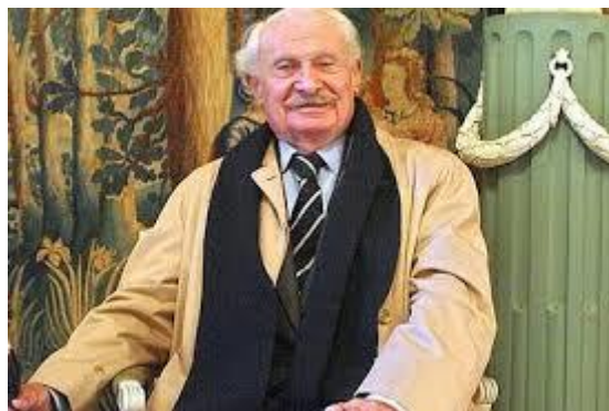
Michel Mohrt (1914-2011)