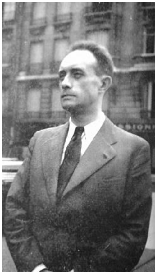
Montherlant au début des années 40