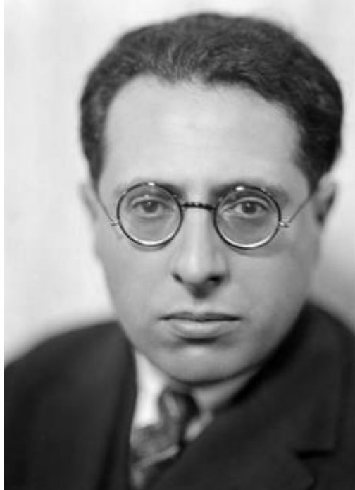
Jean Cassou (1897-1986)

Notes : (1) Jean Cassou , né le 9 juillet 1897 à Deusto et mort le 16 janvier 1986 (à 88 ans) à Paris, est un écrivain, résistant, critique d'art, traducteur, et poète français. Il fut également le directeur-fondateur du Musée national d'art moderne de Paris et le premier président de l'Institut d'Etudes occitanes.